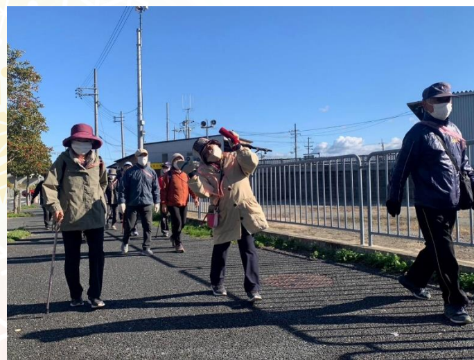
11月25日のまちなか散歩の様子