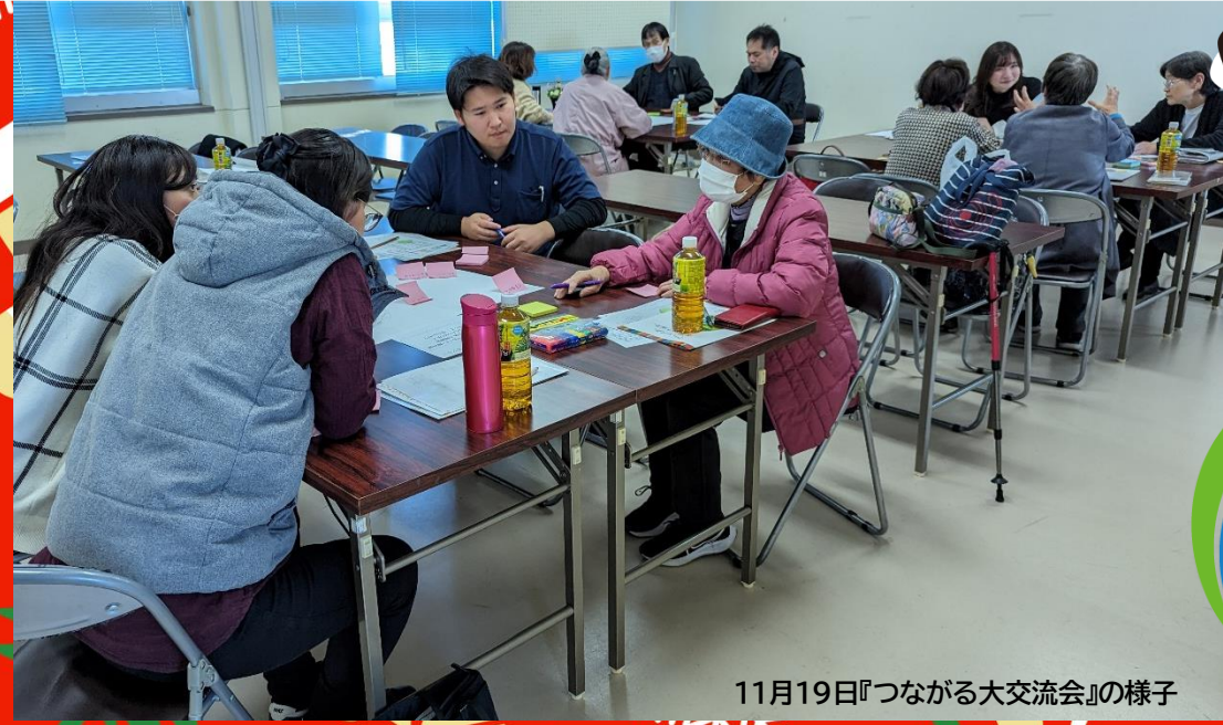
11月19日『つながる大交流会』の様子