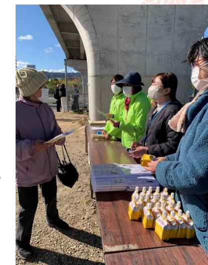
11月25日のまちなか散歩の様子