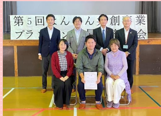
▲2団体の発表者と4人の審査員で記念撮影