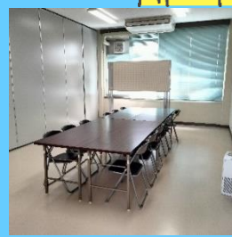
ルーム1 展示室(定員12名)