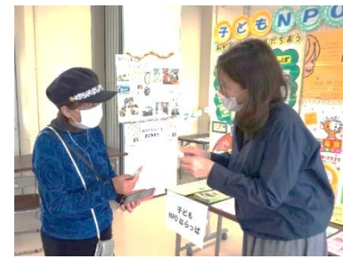
↑ 団体同士の交流もありました