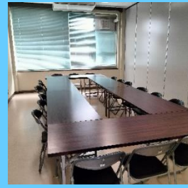
ルーム1 研修室(定員18名)