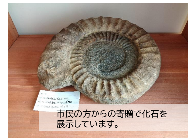
市民の方からの寄贈で化石を展示しています。