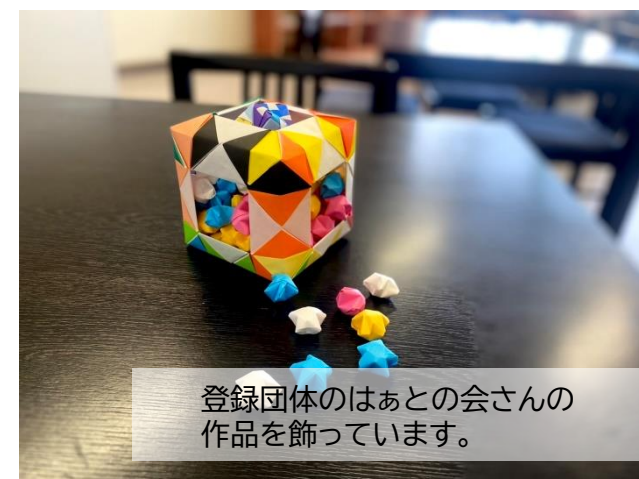
登録団体のはあとの会さんの作品を飾っています。