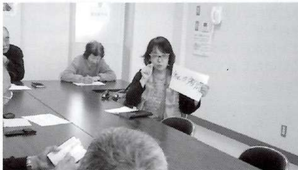
▲トークカードを引いて話をします。