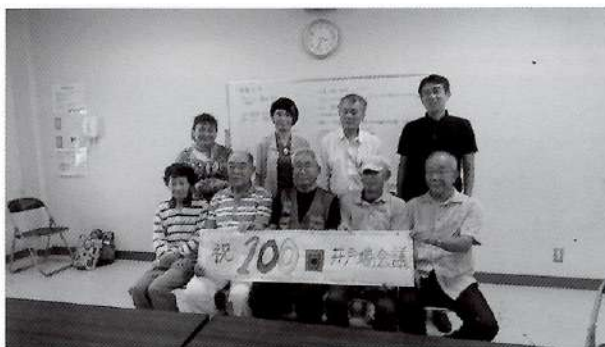
▲平成29年7月には、第100回を迎えました。 みんな笑顔で「ハイ、チーズ」

毎回来てくださる方、初めての方…、阪 南市内のいろいろな地域から参加者が集 まってきていただいています。 この日は何が書かれているかわからない 『トークカード』を1枚引き、そのテーマ にそってお話していただきました。