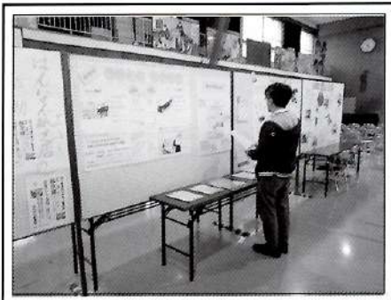
『市民活動センター』はパネル展示で参加しました。