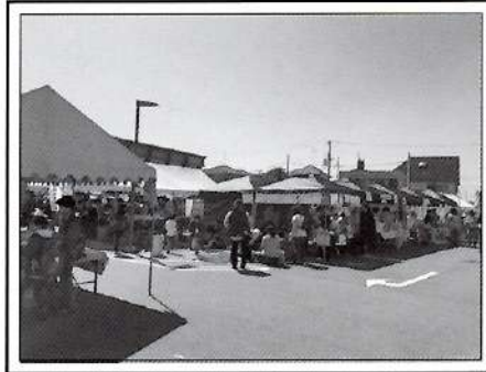
また寒さも厳しい日でしたが、朝早くから色々な年齢層の沢山の方で賑わっていました。