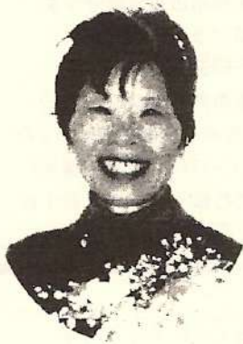
市民活動センター 運営委員長